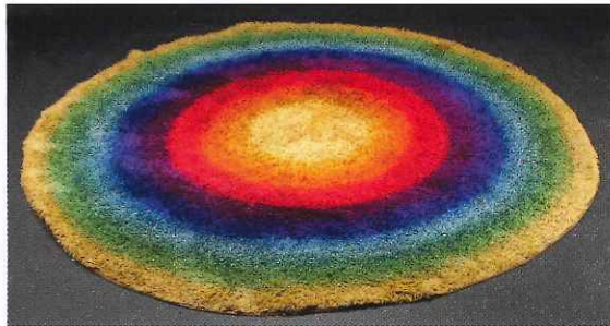
Regnbågsfärgad ryamatta, 8 000 kronor