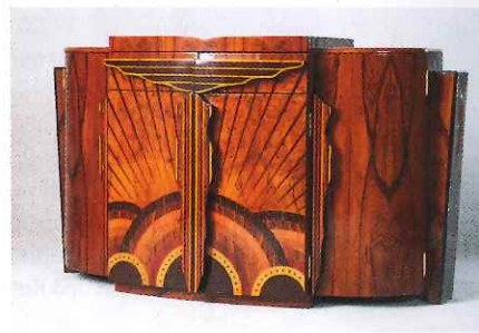
Skänk i art deco-stil, 6 500 kronor