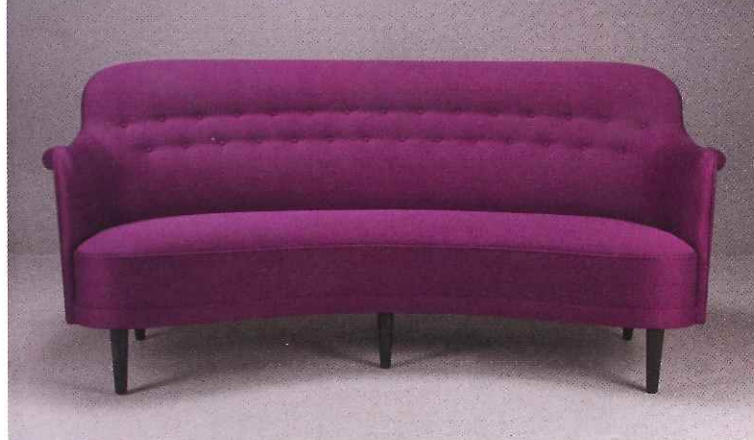
Soffa av Carl Malmsten, tillverkad för OH Sjögren, 22 000 kronor