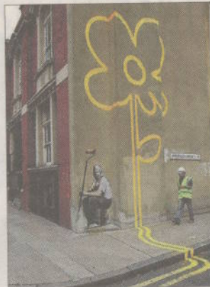
Hetast är konstnären Banksy, vars verk finns att beskåda över hela världen – denna i Bethnal Green, London.

– Vi vill revolutionera auktionsbranschen när det gäller konst och visa att den inte bara finns till för en överklass. Graffitin lever i gatubil-