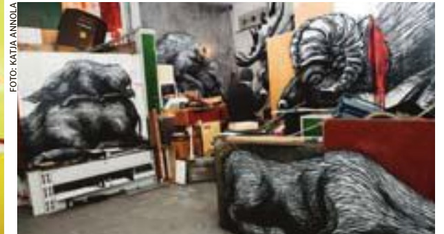
Graffiti-konstnären ROAs installationer går att se på The Scarlett Gallery på Söder.