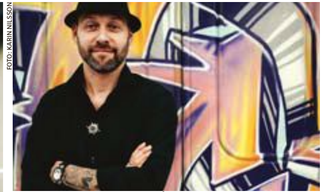
Konstnären Circle ställer ut några av sina verk.