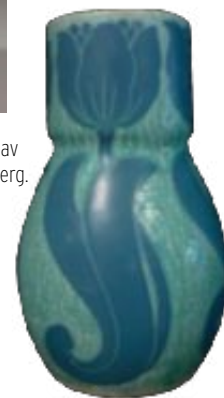
Vas gjord av Josef Ekberg.

"Vill man hålla koll på trenderna inom konst och inredning så är ett bra tips att titta på auktionvärlden för där styr marknaden och inte säljarna på de stora auktionshusen."