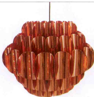
Taklampa i koppar med tillhörande vägglampa av Werner Schou, Coronell Elektro, Danmark, 1960-tal, 2 800 kr.