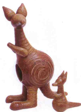
Lisa Larsons känguru i stengods ur serien Stora Zoo, Gustavsberg, 1966-1979, 700 kr.