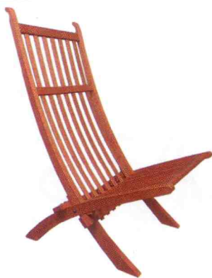
Hopfällbar vilstol i teak, Danmark, 1950–60-tal, 3 800 kr.