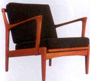
Fåtölj i teak med svarta tygklädda plymåer, Bröderna Andersson, Ekenässjön, 5 400 kr.