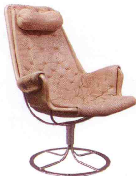
Fåtölj Jetson med stomme och fot av kromat stål och klädd med ljus läder, Bruno Mathsson för Dux, 7 200 kr.