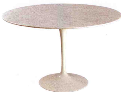
Tulip, bord med vitlackerad aluminiumfot och skiva av marmor, Eero Saarinen, Knoll, 1955/56, 11 000 kr.