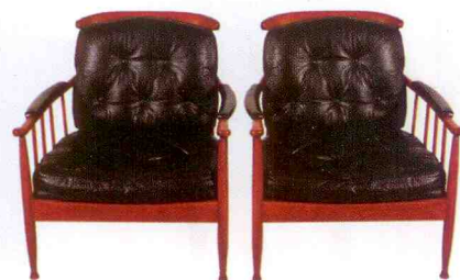
Ett par fåtöljer Skrandan i mahogny av Kerstin Hörlin-Holmquist, OPE Möbler, 7 400 kr.