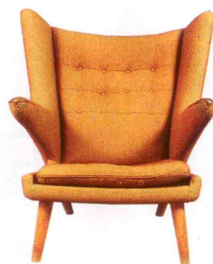
Fåtölj AP-19 Bamse av Hans J Wegner (1914-2007), ek och teak, modellen formgiven 1954, 30 000 kr.