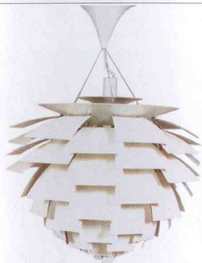
Takarmatur Kotten med överskärm av vit lackerad metall, Poul Henningsen, 31 000 kr.