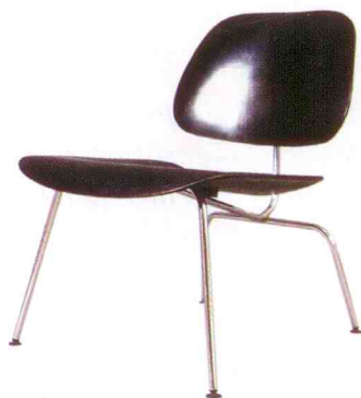
Charles & Ray Eames, LCM stol i svartlackerad ask med benställning i förkromad metall, modellen formgiven 1945-46, 4 900 kr.