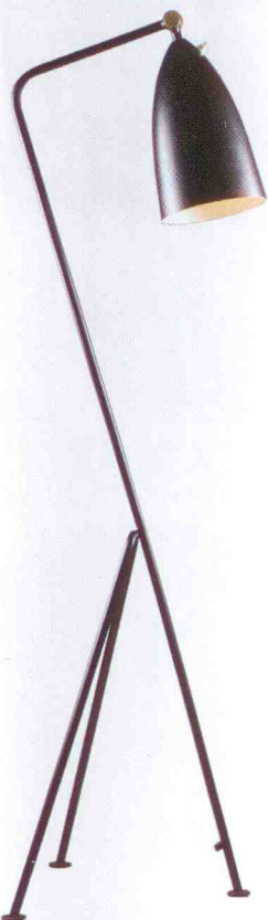
Golvarmatur Grasshopper av Greta Magnusson-Grossman för Bergbohms, 1947-48, 26 000 kr.