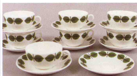
Kaffekoppar ur servisen Berså av Stig Lindberg, Gustavsberg, 1 900 kr för sju delar.

Handeln med antikviteter och design sker numera i allt högre utsträckning via nätet. I det här numret har vi spanat in designmöbler och konsthantverk som sålts online den senaste månaden hos nätauktionsfirman Lauritz.com .