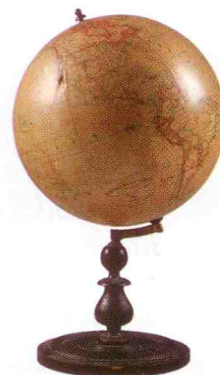
Jordglob, SCHOTTE & Co., Berlin, 1885-1903, 1 200 kr.