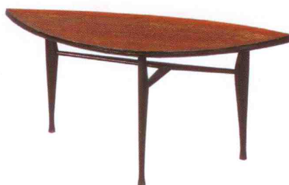
Soffbordet Leaf med bordsskiva av palisander, Yngve Ekström, Westbergs, Tranås, 1 200 kr.