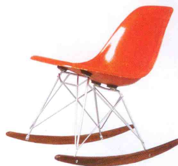
Charles & Ray Eames, gungstol av formgjuten orange glasfiber, medar av valnöt, senare benställning, 2 400 kr.