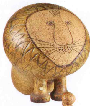
Lejon i stengods, största och minsta storlekarna, ur serien Afrika 1964, Lisa Larson, Gustavsberg, 7 600 kr.