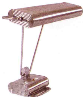
Bordslampa i kromad metall, designad av Eileen Gray för Jumo, Frankrike, 1930-tal, 2 800 kr.