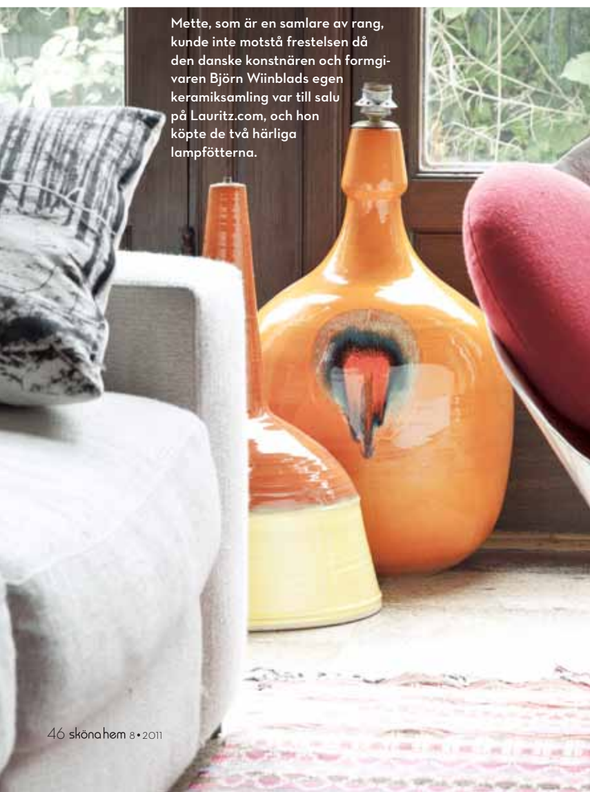
Mette, som är en samlare av rang, kunde inte motstå frestelsen då den danske konstnären och formgivaren Björn Wiinblads egen keramiksamling var till salu på Lauritz.com, och hon köpte de två härliga lampfötterna.