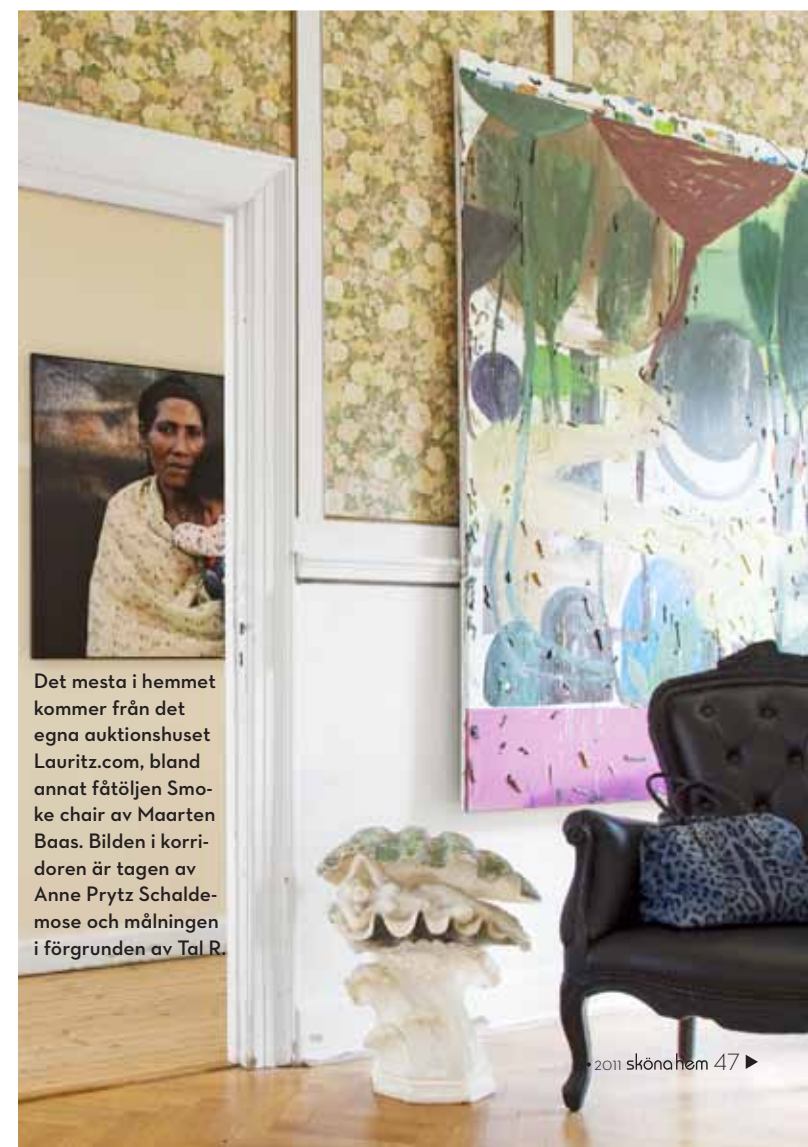
Det mesta i hemmet kommer från det egna auktionshuset Lauritz.com, bland annat fåtöljen Smoke chair av Maarten Baas. Bilden i korridoren är tagen av Anne Prytz Schallemose och målningen i förgrunden av Tal.R.