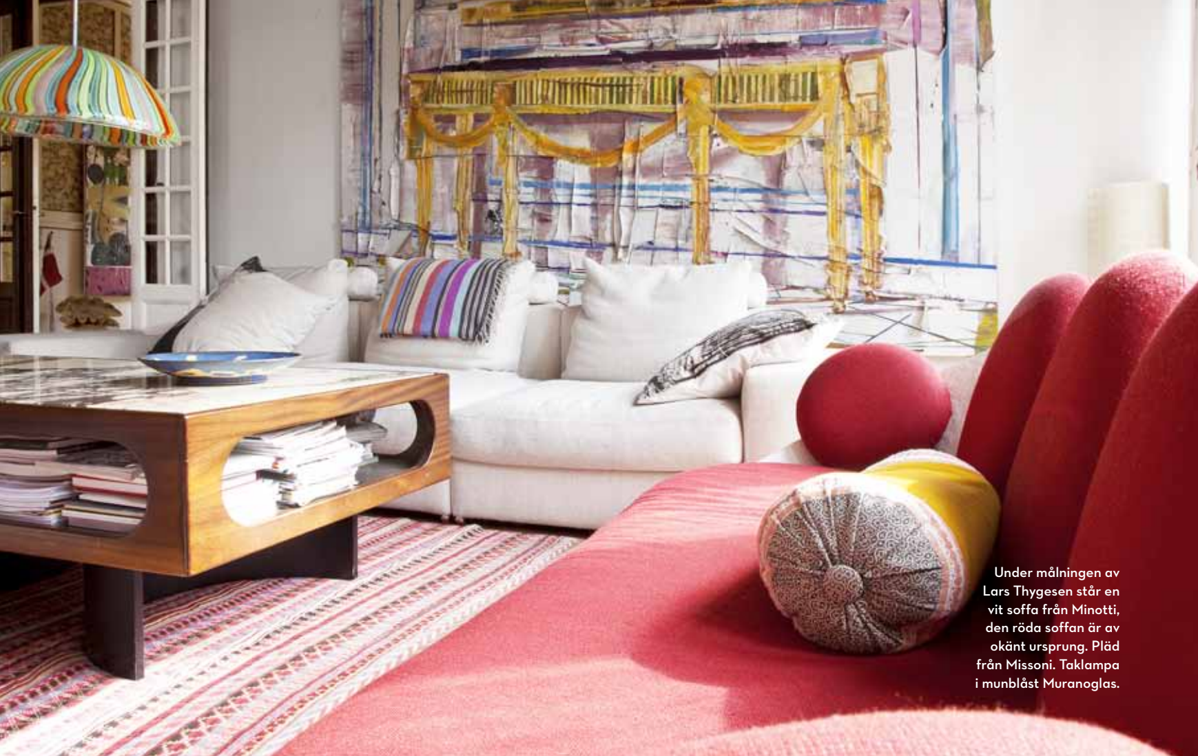
Under målningen av Lars Thygesen står en vit soffa från Minotti, den röda soffan är av okänt ursprung. Pläd från Missoni. Taklampa i munblåst Muranoglas.